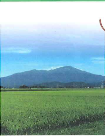
“出羽富士”鳥海山と庄内平野の水田