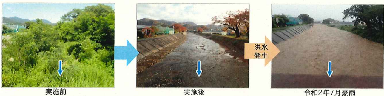
▲日塔川(東根市) 令和元年度実施 堆積土砂撤去