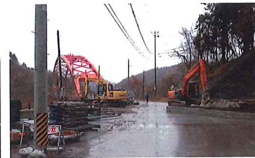
鉄塔基礎コンクリート撤去作業状況