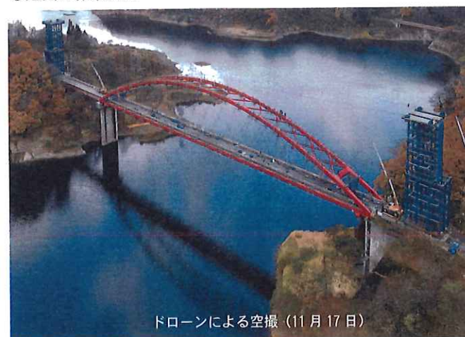
ドローンによる空撮(11月17日)