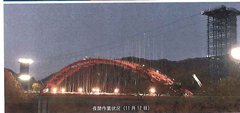
夜間作業状況(11月12日)