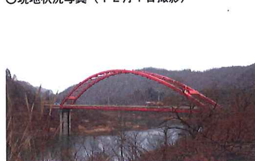
全景(載荷車試験実施中)