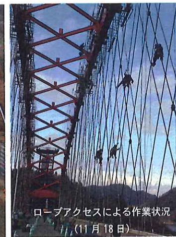
ロープアクセスによる作業状況(11月18日)