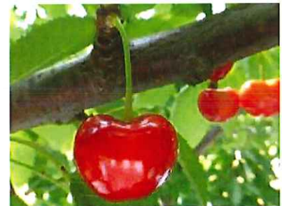
写真 「やまがた紅王」の果実