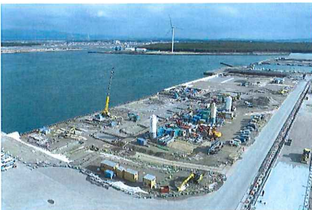
▲岸壁の整備イメージ

洋上風力発電設備の取扱いが可能となることで、海洋再生可能エネルギーの導入を促進し、脱炭素社会の実現へ貢献します。